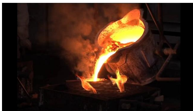
熔煉爐基本構造及澆鑄情形